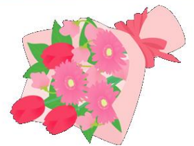
お世話になった方々に花束贈呈