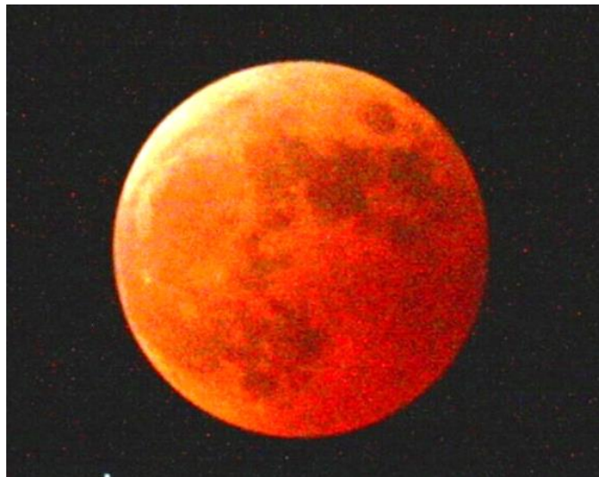
会長撮影の皆既月食

ガバナーの挨拶の中で、RI(国際ロータリー)では10年後くらいに、地区の廃止を検討していることをあっさりと言っていました。2600地区には様々な財産があります。多額の青少年育成基金もその一つです。昨年度6月に緊急決議をして、基金の元金を取り崩しすることにしたこと、ある意味において合点、できました。基本的には個々のロータリークラブを基本の運動体として、地区やゾーンやRIはそれぞれのロータリークラブを補佐していくことが、ロータリークラブであることが分かった話でした。12月末に12月末に東御RC会員数15名が解散消滅するそうです。