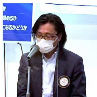
五味職業奉仕委員長