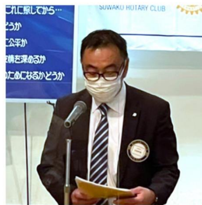
太田社会奉仕委員長