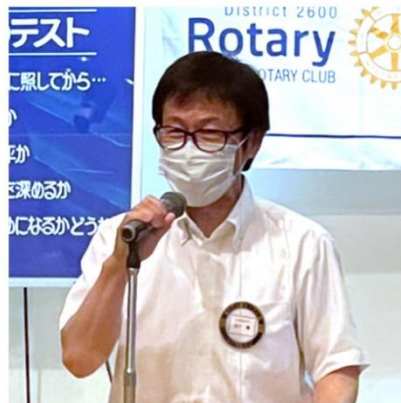
望月クラブ奉仕委員長(副会長)

このほかの報告者の、駒場雑誌 広報委員長は、撮影のため画像なし、 成山国際奉仕委員長は出張のため 音声のみでの参加となりました