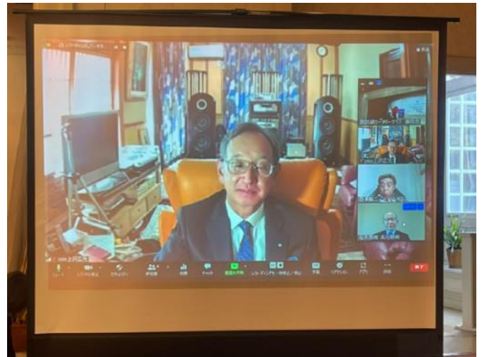
上沢広光ガバナーエレクト様、

本日は上沢広光ガバナーエレクト様、古川静男 パストガバナー様を ZOOM でお迎えし、佐藤遼太 郎様は、ZOOM 例会の見学のため会場にお見えに なりました。お客様には、それぞれお言葉をいた だきました。ありがとうございました。