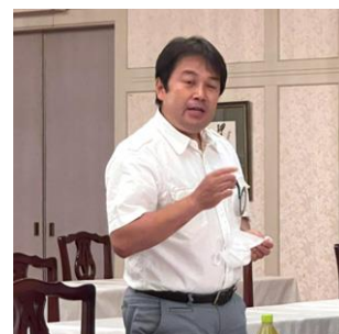
本日はウナギ弁当 & コロナワクチン情報でした