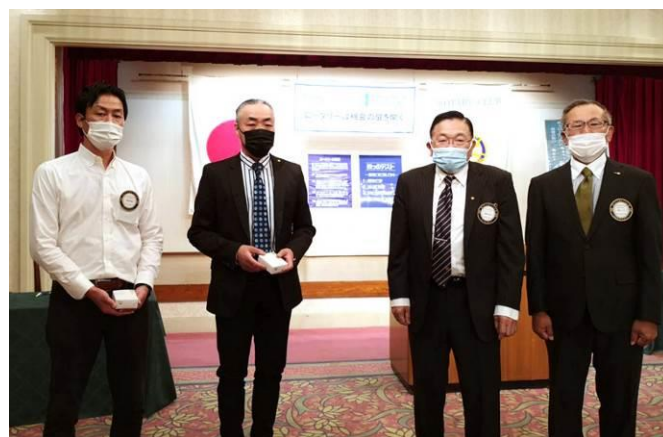
本年度会長幹事と次期会長幹事 バッチ交換