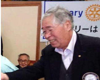
高山会員は休みでした