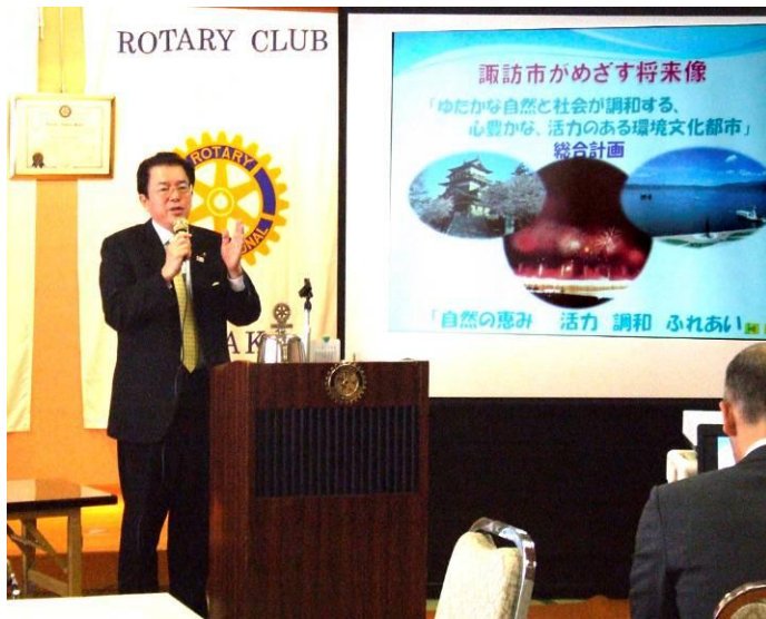
使用されたプレゼンテーションスライドの一部

詳細はホームページに使用されたプレゼンテーションスライドを掲載予定ですのでご覧ください。