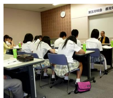
基調講演と第5分科会